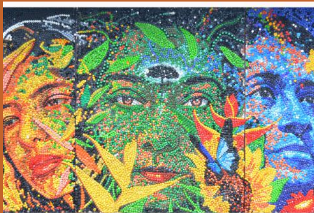
Mujeres Víctimas del Conflicto Armado David Marín